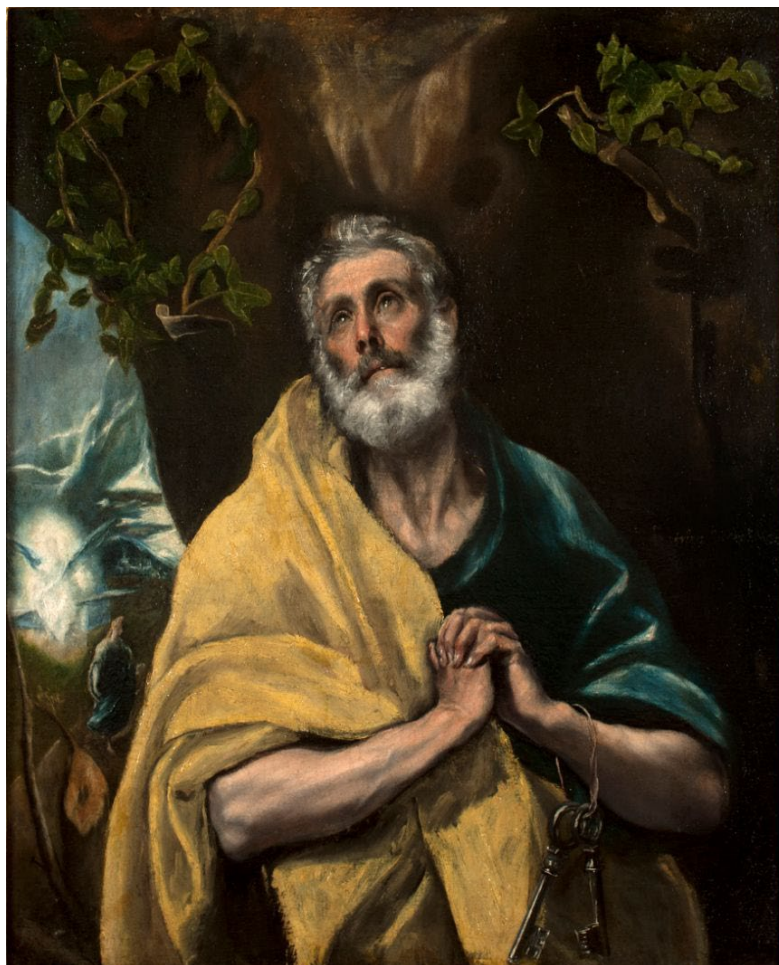
Figura 3. Las lágrimas de San Pedro .

Con relación a la sociología en la construcción de la noticia ( news making ), se puede decir que El Greco residía en Toledo, la ciudad de los reyes y cruce de culturas católica, musulmana y sefardí, y su modo de vida era la pintura. Reyes y religión eran los temas que recibía como encargo, con escaso margen para huir de esa rutina productiva e improvisar.