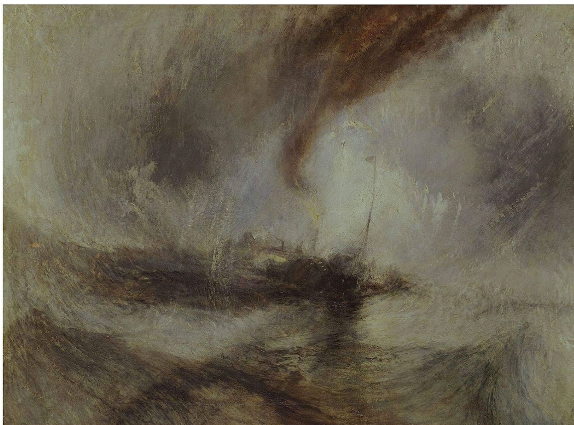
Figura 2. Tormenta de nieve en el mar.

Interpretación y relación con las teorías de la comunicación: Cabe incluir esta forma de trabajo en el género periodístico de la crónica. El periodista, desde primera línea, narra los hechos, dando color a su relato, al igual que Turner recurre al color. Se produce una implicación máxima del autor (el pintor arriesga su vida, atado al mástil) y por lo tanto tiene sentido traer a colación aquí la figura de los corresponsales de guerra.